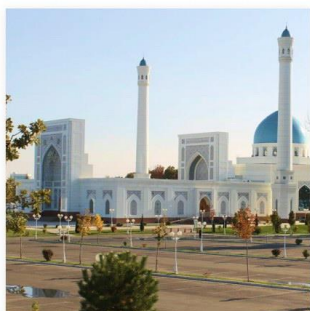
Ташкент (Республика Узбекистан, 2018 г.)